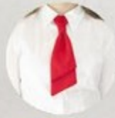
АРТ. 2-12 ГЛАСТУК ДВОЙНОЙ