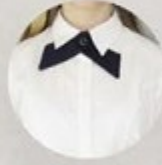
АРТ. 3-12 ГЛАСТУК БАБОЧКА