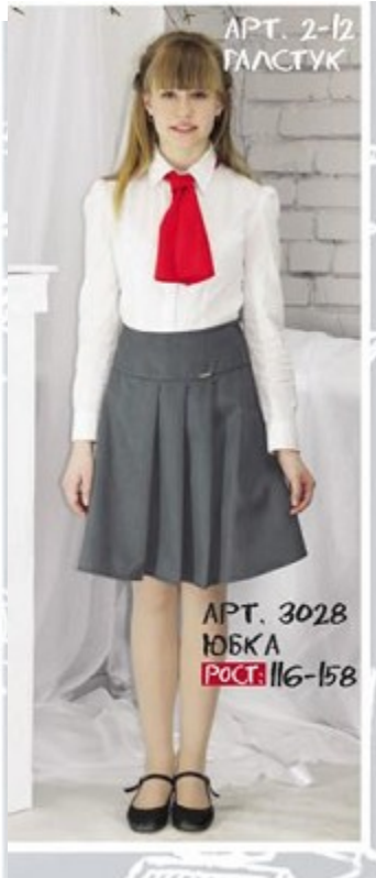
Арт. 2-12 МАСТЫК Арт. 3028 ЮБКА Рост: 116-158