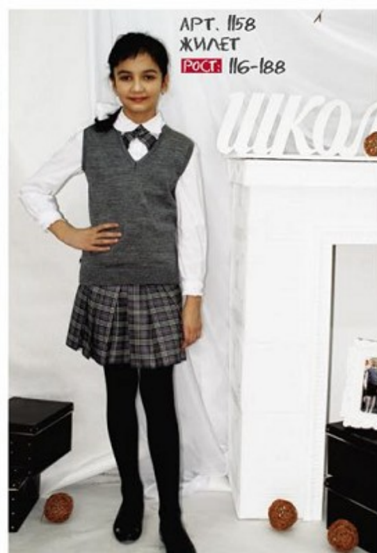
АРТ. 1158 ЖИЛЕТ РОСТ: 116-188