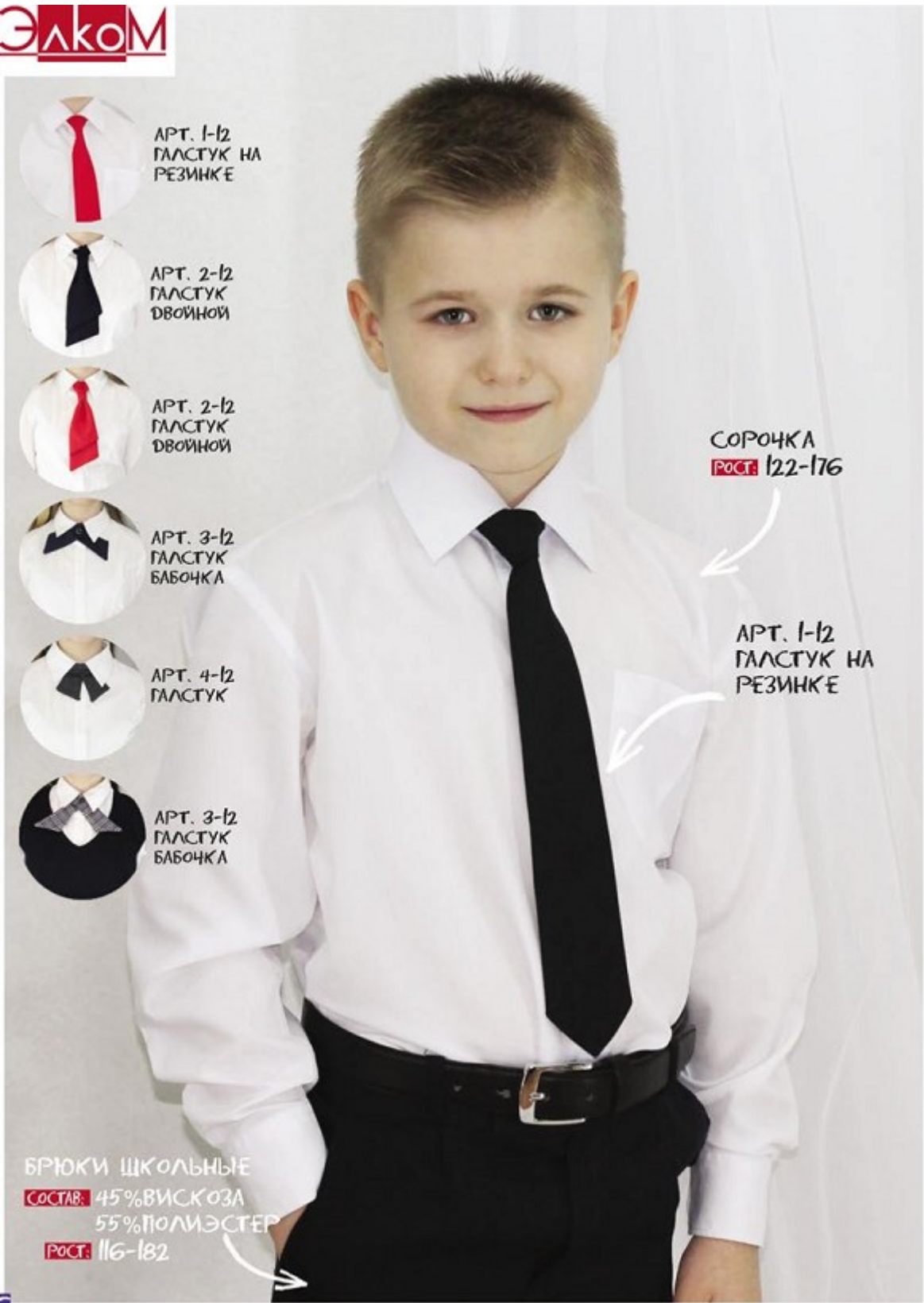
СОРОЧКА РОСТ: 122-176