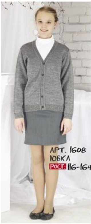
Арт. 1608 ЮБКА Рост: 116-164