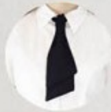
АРТ. 2-12 ГЛАСТУК ДВОЙНОЙ