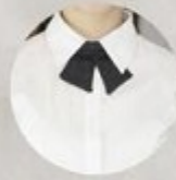
АРТ. 4-12 ГЛАСТУК