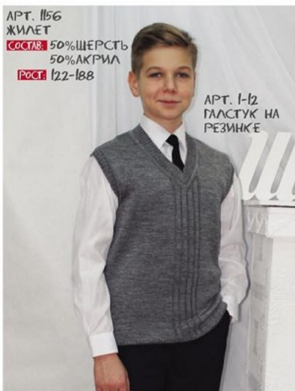
АРТ. 1156 ЖИЛЕТ СОСТАВ: 50% ШЕРСТЬ 50% АКРИЛ РОСТ: 122-188