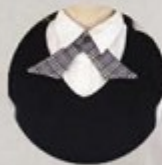
АРТ. 3-12 ГЛАСТУК БАБОЧКА