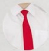
АРТ. 1-12 ГЛАСТУК НА РЕЗИНКЕ